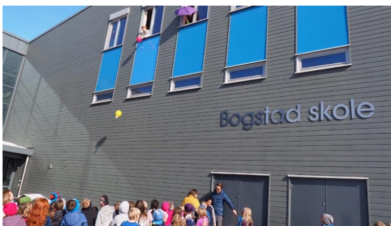
Tradisjonen tro arrangerte 2.trinn "Eggdrop" før påske.

Læringsmiljøet vet vi, er avgjørende for god læring. På Bogstad jobbes det hver dag, i hvert klasserom og på AKS, med dette. Lærere og ledere jobber tett i samarbeid med foresatte og det skal være lav terskel for å si ifra hvis det er noen som ikke har det bra. Jeg opplever en åpen dialog med foresatte og er helt prisgitt at dere snakker til oss og ikke om oss. Jeg gjentar, det vi vet, kan vi gjøre noe med.