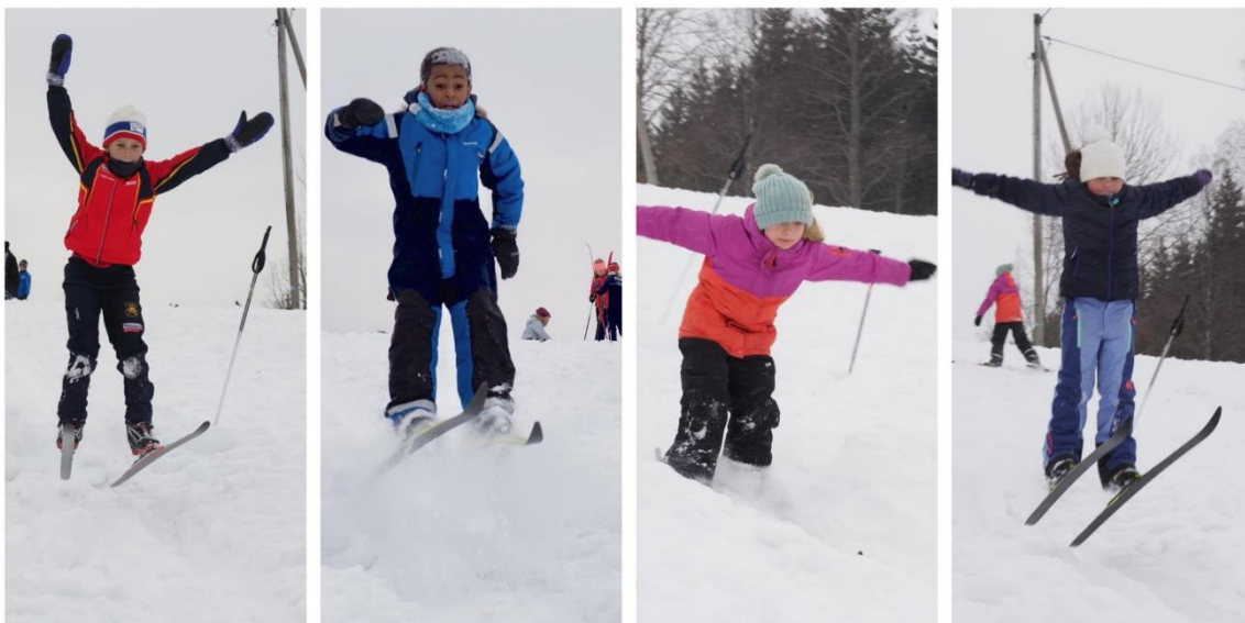
4.trinn har brukt lek på ski for å styrke elevenes trivsel.

FAU er en viktig samarbeidspartner for skolen og i mars har det også vært FAU- møte. Her fikk skolen legge frem arbeidet med elevenes læringsmiljø, rutiner for utfordrende adferd og igjen minne på at vi er avhengige av at dere sier ifra om det er noe skolen trenger å vite. Det vi vet kan vi gjøre noe med.